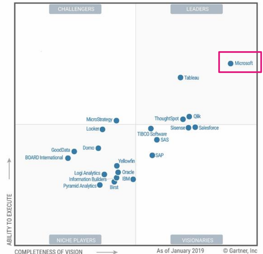
Figure 1. Magic Quadrant for Analytics and Business Intelligence Platforms