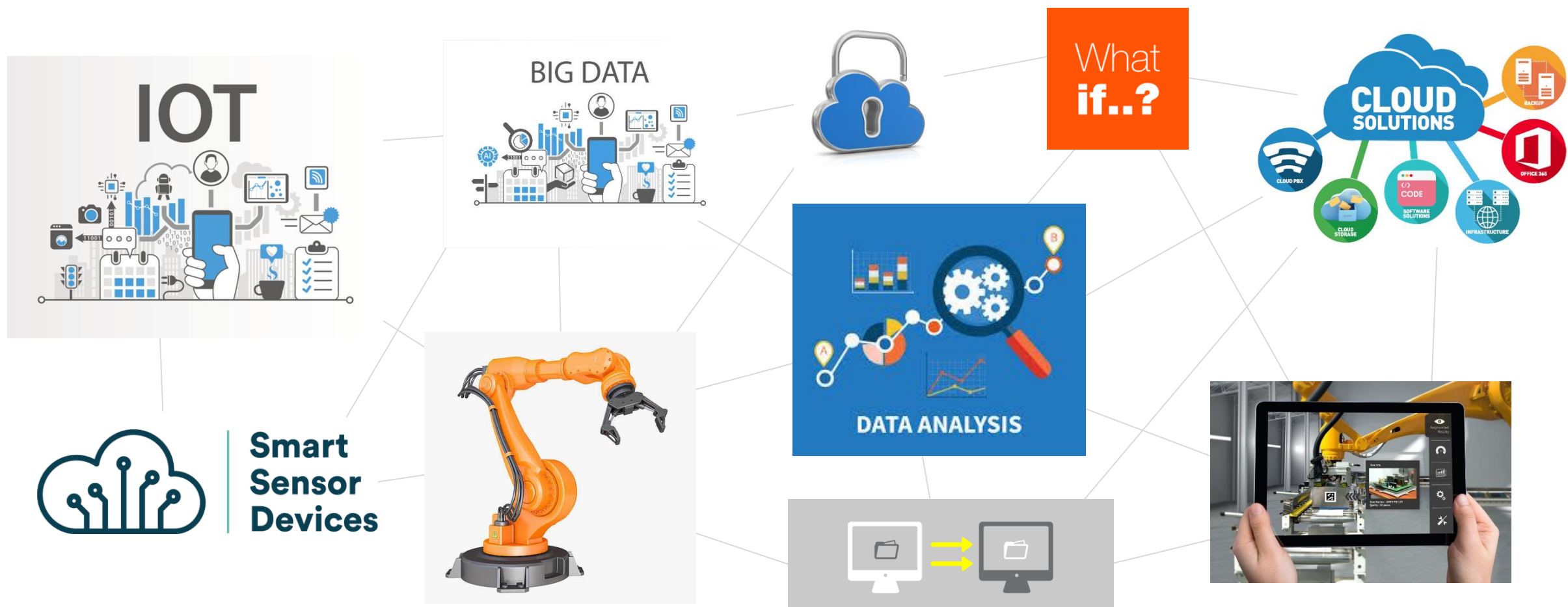
Avtomatična izmenjava podatkov