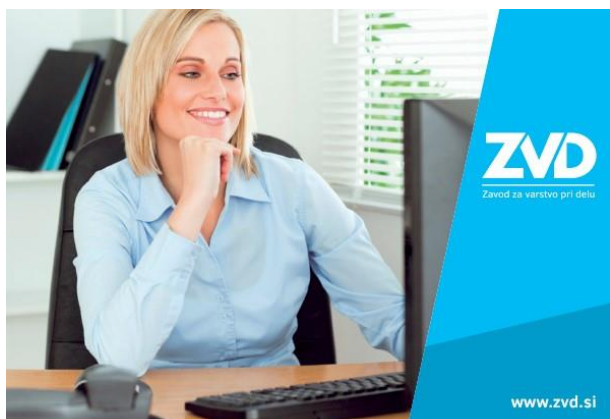
Slika 1: Vstopna stran portala ZVD

Nedavna anketa LinkedIn skupine E-izobraževanje je odkrila, da kar 71,4 odstotka uporabnikov rešitev za e-izobraževanje izkorišča digitalne pristope pri izvajanju zakonsko obveznih usposabljanj. Pri tem so v hitrem porastu predvsem usposabljanja po Zakonu o varnosti in zdravju pri delu (ZVZD).